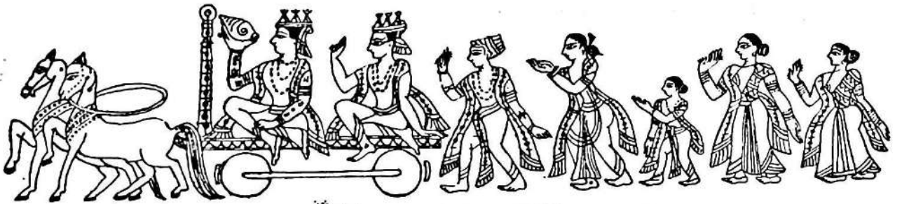
কৃষ্ণ-বাস ঘৰুৱাক যাত্ৰ

আনন্দত অধীৰ হৈ দুয়ো দুয়োকে আকোৱালি ললে । তৰুয়ে নতাক বুকুৰ মাজত সাৱতি ললে । আজীৱনৰ কাৰণে—চিৰ সঙ্গী হিচাবে । তৰুক আশ্ৰয় কৰি নতাই লাহে লাহে বগাবলৈ ধৰিলে । বংবিৰঙৰ সাজেৰে স্মৃসজ্জিতা হ'ল নতা । লহ পহকৈ বগাবলৈ ধৰিলে । আনন্দত তৰুয়ে মেলে নিতে ন ন ডাল পাত—নতাক আশ্ৰয় দিবলৈ, তাৰ প্ৰাণৰ নতাক, আনন্দতে দুয়ো নাচে হালে-জালে ।